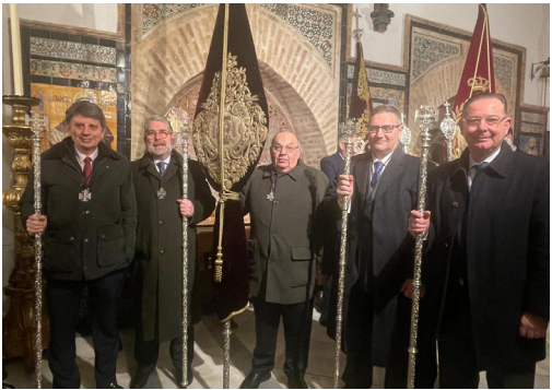
Traslado de la Hermandad de los Javieres