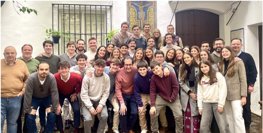
Convivencia Navidad del grupo joven