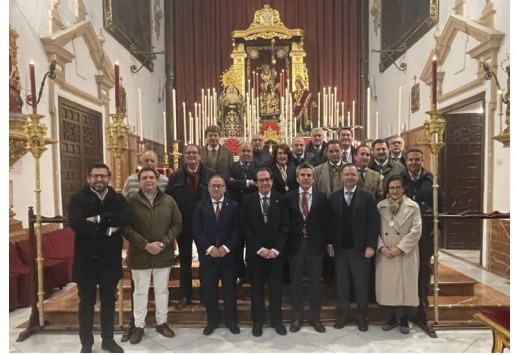
Quinario San Roque