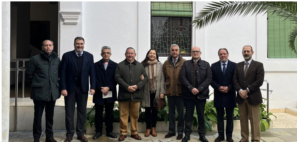
Acción del Martes Santo en el colegio Ángela Guerrero de las Hermanas de la Cruz

del valle, a Cáritas diocesana, al Centro de acogida Luis Amigó, a la Parroquia de Marismillas, donde donamos juguetes y artículos para la Tómbola, a La Fundación Padre Leonardo con la que viajan enfermos a Lourdes y acompañamos en el mes de junio durante los tres años anteriores.