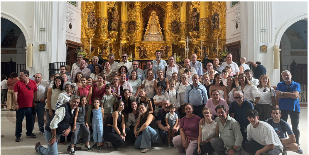
Peregrinación al Rocío