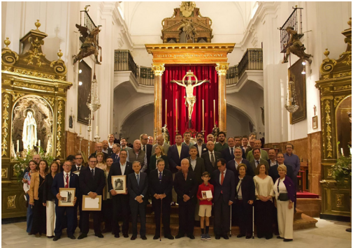
Donantes altar Stmo. Cristo de las Misericordias