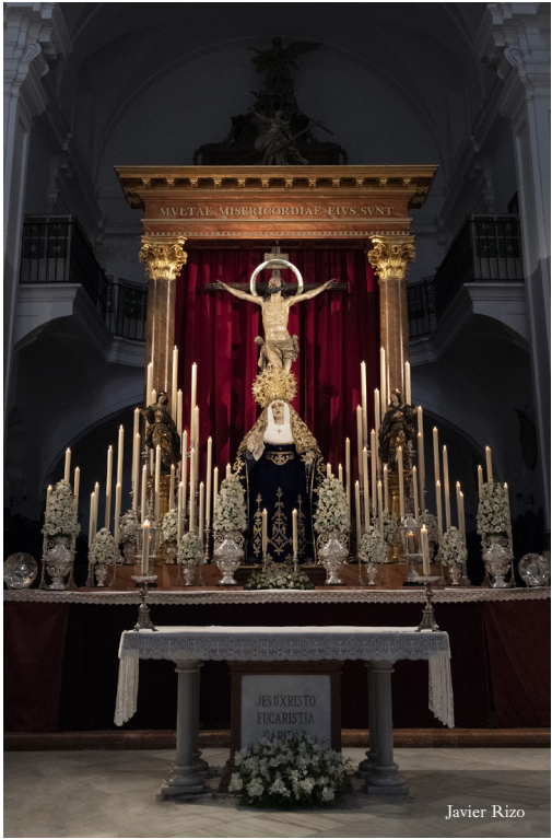
Triduo Nuestra Señora de los Dolores