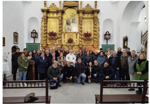
Retiro de Adviento