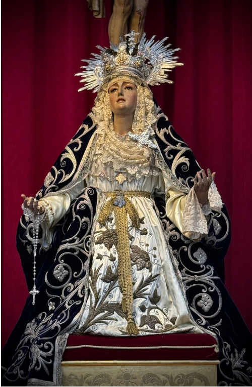
Función Solemne Santa María de la Antigua